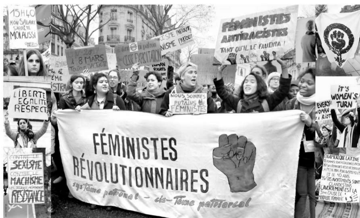
8 mars 2017, journée internationale de luttes des femmes. Pour l'égalité des droits ! Solidaires

Le CNDF - Collectif National pour les Droits des Femmes - est aussi constitué d'organisations associatives, syndicales et politiques ; il s'est constitué après la manifestation du 25 novembre 1995, qui à l'orée du mouvement social des semaines suivantes, a rassemblé 40 000 personnes dans la rue. Il se fixe comme objectif de faire passer dans les faits, dans la pratique, l'égalité formelle que les femmes ont conquise durant tout le vingtième siècle.